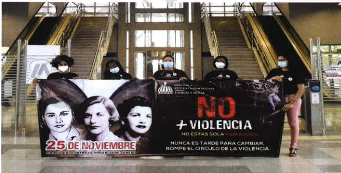
Ministerio de Energía y Minas a través de la Unidad de Género realiza jornada de sensibilización sobre la prevención de la violencia de género en el marco del 25 de noviembre, 2020. En la imagen, visita estación del metro Hnas. Mirabal.