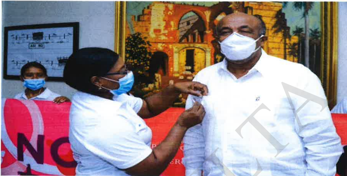
Antonio Almonte , ministro de Energía y Minas, al igual que en el 2020 recibe miembros de la Unidad de Género, como parte de las actividades alegóricas a la conmemoración del 25 nov. 2021.